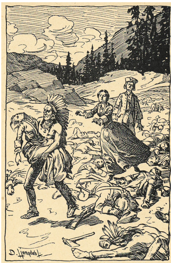
Bild 2. Illustration av David Ljungdahl. Ur James Fenimore Coopers Den siste mohikanen (1949, 4 uppl.), s. 90.

Fortsättningen är full av makabra detaljer. Den hemska stämningen förstärks av David Ljungdahls illustration som föreställer högar av lik (bild 2).