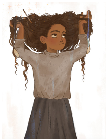
Bild 12 och 13. Motivet Blackhermione i fanart.