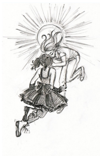
Bild 1 och 2. Två fanbilder på Linnéa och Vanessa med romantiska inslag. 10