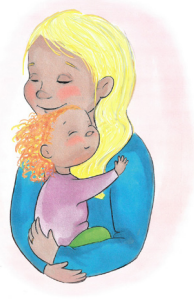
Bild 7, 8 och 9. Goda stunder mellan barn och sjuk vuxen. Ur Min skalliga mamma (2018) av Camilla Dahlson och Katarina Vintrafors (27, beskuren), Min pappa superhjälten (2020) av Emil Arnell och Johanna Arnell, En dum knöl i mammas bröst (2022) av Annie Hagvall Einarssrud och Hanna Ingvarsson. © Katarina Vintrafors, Johanna Arnell och Hanna Ingvarsson.