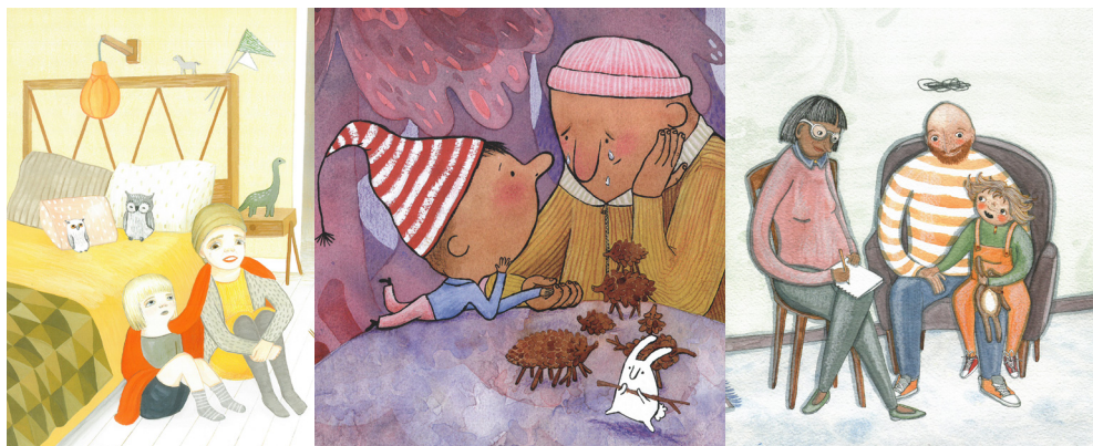
Bild 4, 5 och 6. Barnet och en vuxen samtalar om sjukdomen. Ur Mammas Liv (2014) av Mi Tyler och Malin Ahlin (beskuren), Pappan som tappade bort glädjen (2021) av Camilla Gunnarsson och Maya Jönsson (beskuren) och Ett hav i vardagsrummet (2020) av Gabriel Häggebrink och Signe Gabriel (beskuren). © Malin Ahlin, Maya Jönsson och Signe Gabriel.

Vid sidan av böckernas pedagogiska tilltal framträder här en gömd, sårbar vuxennärvaro, som utgår från barnets empati med den sjuka förälderns kris. Personifierad i berättelsens sjuka vuxenkaraktär, erbjuder detta vuxna tilltal den implicita medläsaren som delar