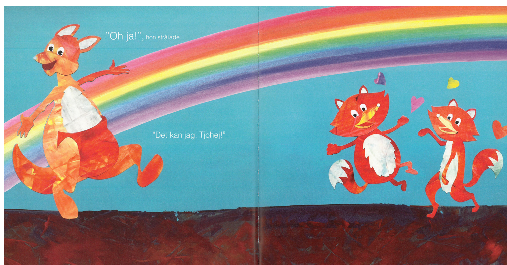
Bild 3. Fru Känguru hjälper gärna rävarna att få egna barn. Ur Vems mage bodde JAG i? (2020) av Manuela O'Reilly. © Manuela O'Reilly.

av surrogatmamman. Medan hon i surrogatvänliga vuxensammanhang återkommande beskrivs som en osjälvisk ängel eller madonnagestalt, är hon i surrogatbilderboken ett lyckligt djur, en snäll vän eller en god fe som enbart motiveras av sin önskan om att uppfylla de tilltänkta föräldrarnas drömmar om att skapa en kärnfamilj (bild 3). 8 Surrogatmödrskapet skildras därmed aldrig som ett arbete, utan som en frivillig gåva som de tilltänkta föräldrarna betalar för symboliskt genom sina lidanden och ansträngningar (jfr Hvidtfeldt Madsen 86).