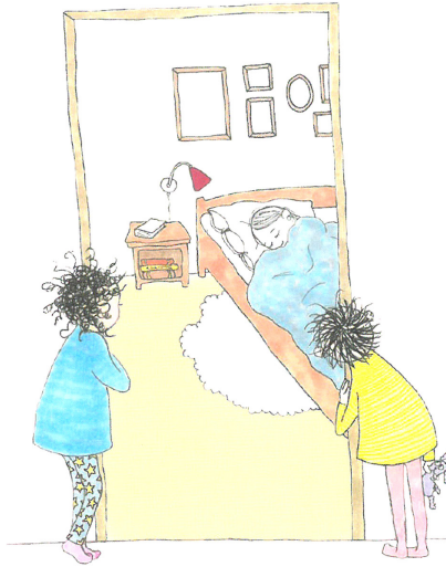
Bild 10. Barnen betraktar sin utmattade mamma. Ur Buller om huller i Mamma Grå (2018) av Jessica Hedberg och Eva Forssell. © Eva Forssell.

en potentiellt smärtsam konfrontation med rädslor och skuldkänslor inför den egna oförmågan att modra och de konsekvenser som detta kan få för barnet. I skarp kontrast till dessa vuxna erfarenheter av att inte räcka till, framstår de goda stundernas närhet och värme som tröstande. De berättar om begäret efter att kärnan i relationen till barnet – den ömsesidiga kärleken – ska kunna bestå trots att föräldern inte förmår vara emotionellt tillgänglig och villkorslöst själv-uppoffrande, men också om föräldrarnas begär efter att själv bli bekräftad och omhändertagen genom barnets empati. Påfallande ofta skildras högläsningen som en del av de goda stunderna mellan barn och modrande vuxen och får då funktionen av en reparativ akt där kärlek och förtrolighet kan återupprättas. 13 Läsningen som väg till läkning för både barnet och den vuxna, aktualiseras även på metanivå i relation till sjukdomsböckernas biblioterapeutiska syfte; det samtal som i böckerna är lösningen på barnets kris är en direkt spegling av det verkliga samtalet mellan barnläsare och vuxen medläsare som högläsningen kan initiera.